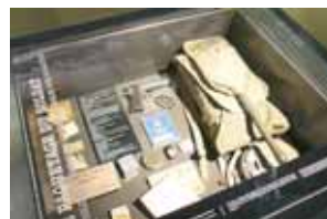
Objets du quotidien des soldats.