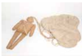
Poupée Rupert qui rappelle l'opération Fortitude.